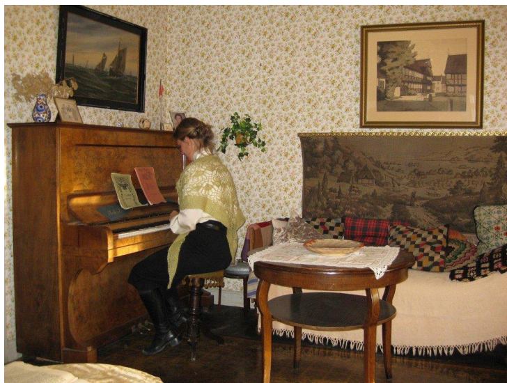
Fra lærerindens bolig på Flakkebjerg Skolemuseum – en del af Museum Vestsjælland