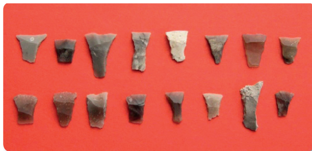
Tværpile fra Rendsborgparken

I foråret og sommeren 2015 foretog Museum Vestsjælland en udgravning af en større boplads fra bondestenalderen ved Rendsborgparken i den østlige del af Kalundborg. Bopladsen er fra tragtbæger-kulturens midte, omkring 3000 f. Kr. og har ligget på nordsiden af den fossile Kalundborg Inderfjord, hvor Kærby Å i dag løber. Under muldlaget fandt arkæologerne resterne af flere huse, et depotfund med brændte mejslers og tusindvis af genstande fra de folk, der boede på pladsen for omtrent 5000 år siden. Ved foredraget vil pladsen blive set i lyset af de øvrige fund fra bondestenalderen i Kalundborg og Vestsjælland.