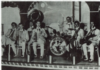
Spencers Washboard Kings

Det næste arrangement blev også et stort show, men på en noget anden måde. Cap Horn Blowers må have troet, at den