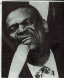
Earl "Fatha" Hines

Den 11. november var der et festligt gæstsyn med Sponzers Nockboard Kings, der musikalsk set var endnu bedre end året før.