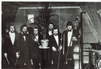
Papa Henz Viking Jæskhardt

færrygende afslutning, idet klubbens andet tjekkliske orkester, Jazz Combo, samlede ikke mindre end 300 mennesker.