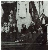
Petersen Big City Band