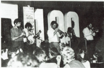
Parva Parva Band