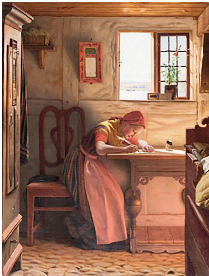
En pige, der skriver, 1871.

Dalsgaard blev ridder af dannebrog i 1879, og han modtog hædersbevisnin-gen titulær professor ved Det Konge-lige Danske Kunstakademi i 1892. I 1904 blev han dannebrogsmænd.