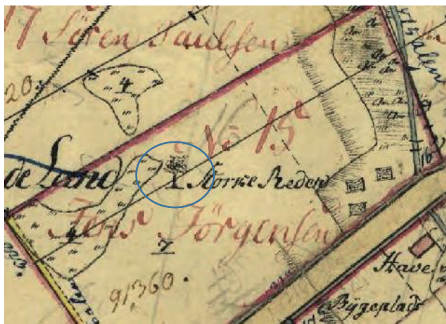
Udsnit af matrikelkortet.