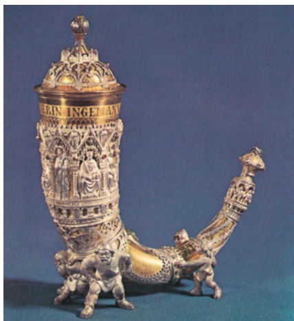
Guldhornet som blev skænket til Ingemann

det stjålet, men kom tilbage efter 40 år – ret utroligt.