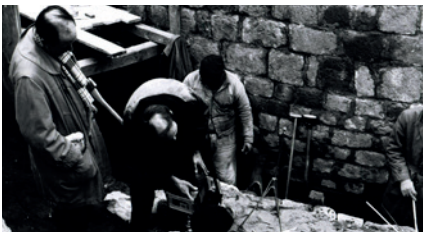
Pedersborg rundkirke, 1957.