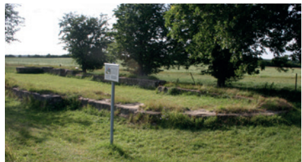
Skt. Knud Haraldsted, 2015.

Entré for ikke medlemmer er 75 kr.. Der serveres kaffe. Brød kan købes.