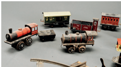
Modeltogsmateriel i blik.

I 1826 begyndte man i Nürnberg at lave små lokomotiver og togvogne af blikplader, som lignede de daværende lokomotiver og vogne. Der var ingen skinner, og lokomotiverne kunne ikke selv køre, det var udelukkende ”skubbetog”, som børnene kunne lege med.