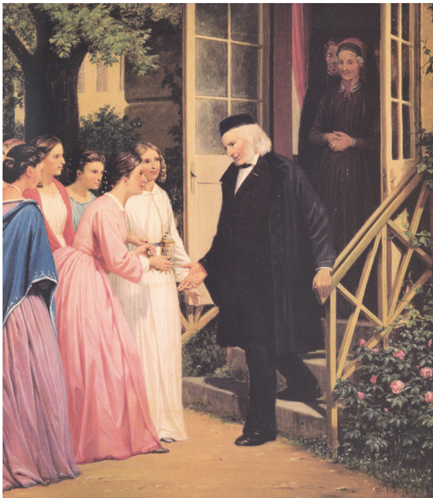
I 1859 modtog Ingemann et smukt og kostbart guldhorn fra det danske folk. Maleri af Sonne.

Lykken gækker store, små, leger med guldterning; lykkeligst at hvile på er fuldendte gerning.