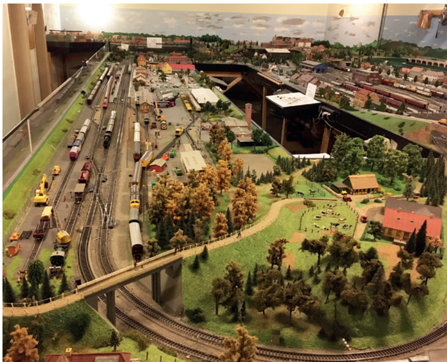
Modelbaneanlæg i Sorø.

kældre eller på lofter, eller hvor der nu var plads. Det var også et hedt og højt placeret ønske på børnenes – og her må vi vist fortrinsvis sige drengenes – ønskeseddel. Mig bekendt slog denne hobby aldrig rigtig igennem hos pigerne.