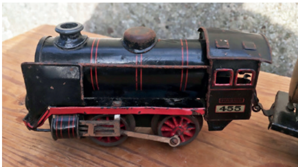
Optrækkeligt lokomotiv fra 1930'erne.

Da nu Märklin havde etableret nævnte standardisering, begyndte andre fabrikanter at fremstille tog, som kunne køre på disse standarder, og det åbnede for, at man nu efter eget ønske, behov og lyst kunne køre med en sammenblanding af materiel fra forskellige virksomheder,