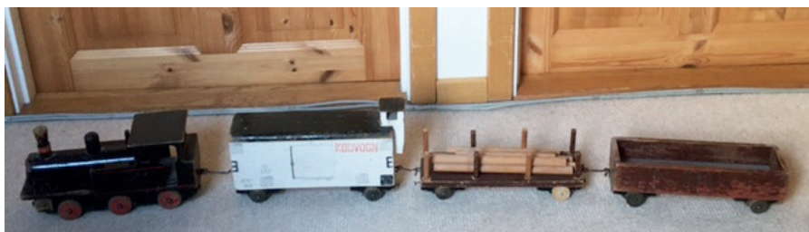
Træmodeltog: Onkel Haralds tog.