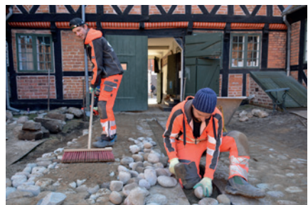
I foråret 2021 blev pigstensbelægningen udført.

Gårdrummet har ændret sig gennem tiden, på gamle fotos kan man se en brønd med pumpe midt i gården, en hæk og træer. Efter Sorø Museum flyttede ind i 1929, blev der sat et springvand