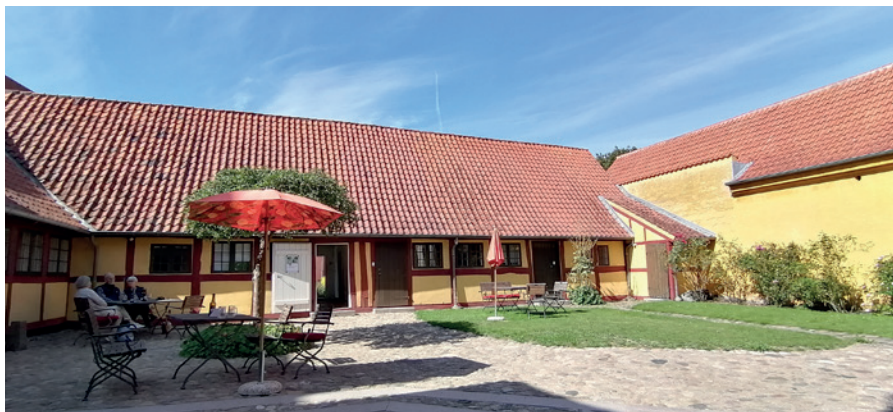
En smuk gårdsplads hvor man kan nyde sin kaffe. Foto fra 4. september 2021.

op i gården. Springvandet er for længst taget ned igen, og gården ser i dag meget anderledes ud.