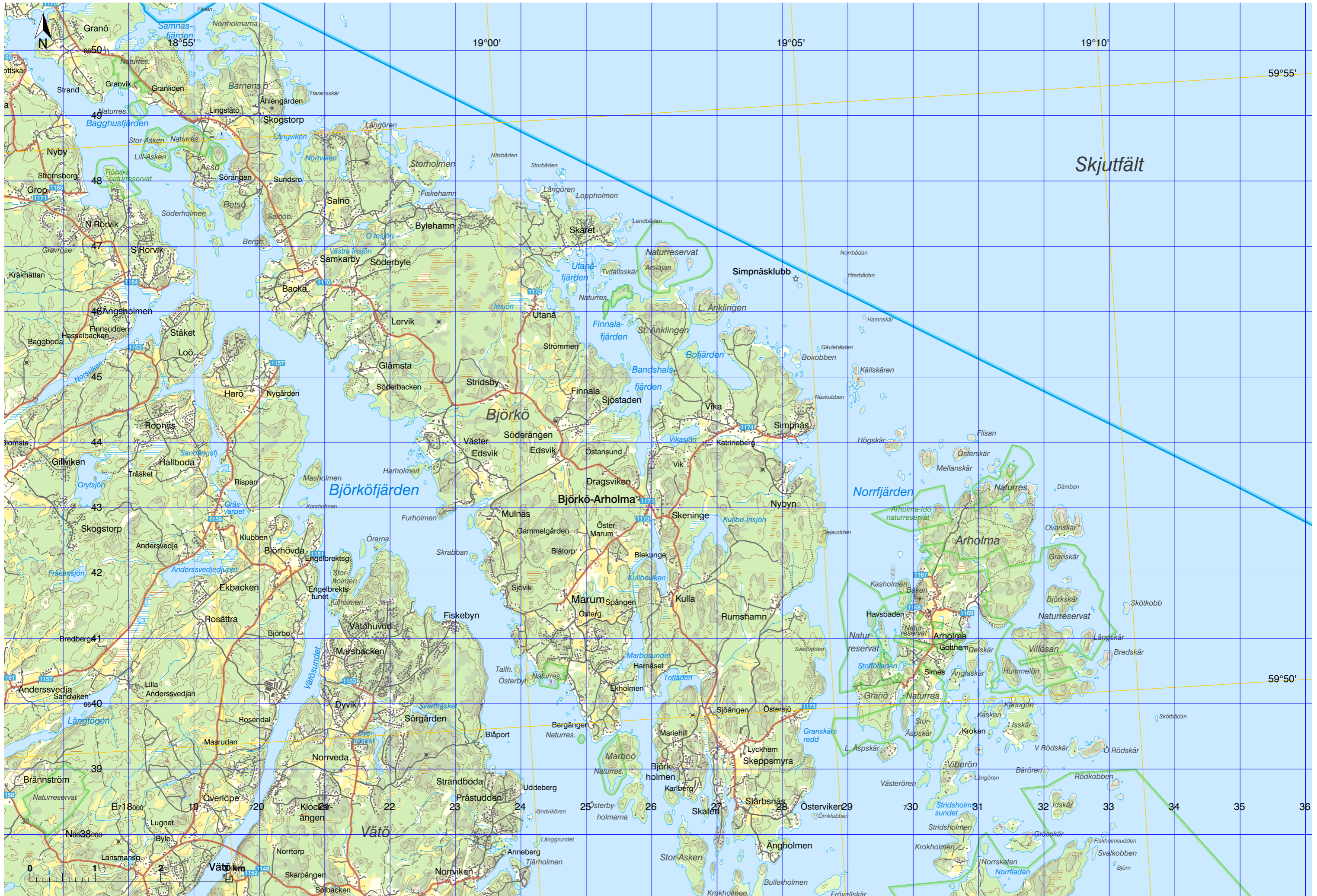
Skala 1:50 000, SWEREF 99 TM, RH 2000.