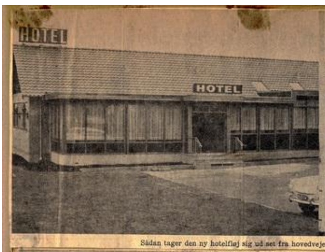
Sådan tager den ny hotelfløj sig ud set fra hovedvejen

Med denne, viser det sig, gunstige placering ved en stærkt trafikeret hovedvej med et stigende antal gæster og turister, der efterspørger overnatningsmuligheder, træffer fru B. beslutning om yderligere udvidelse, så der mod øst, vinkelret på den eksisterende bygning opføres en ny hotelfløj med 10 værelser, og samtidig indrettes et nyt stort køkken med alle de moderne faciliteter, kokke og køkkenpersonale kan ønske sig.