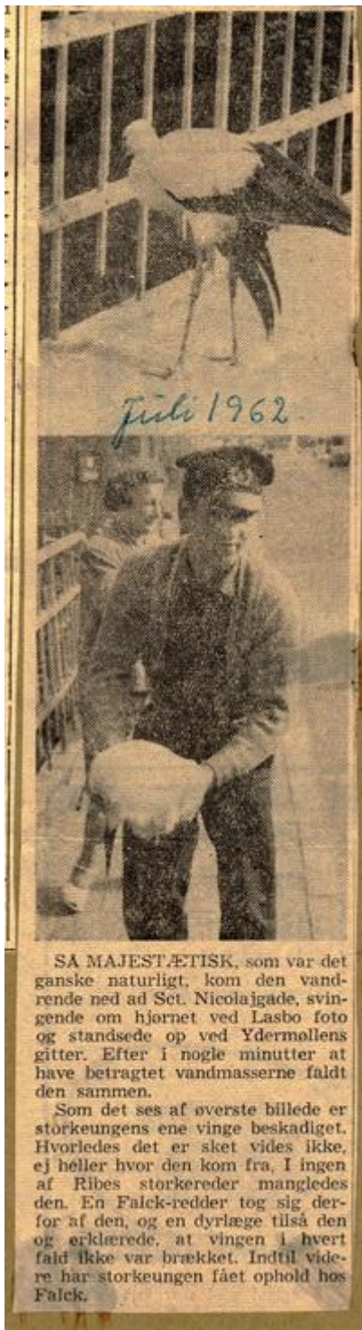
Folkebladet juli 1962