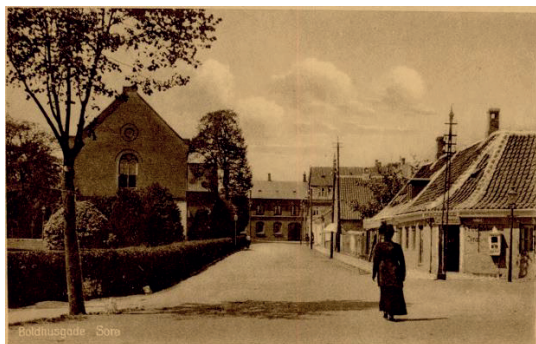
Postkort der viser Boldhusgade omkring 1912.