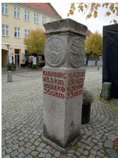
0-km stenen som den så ud den 23. oktober 2020.