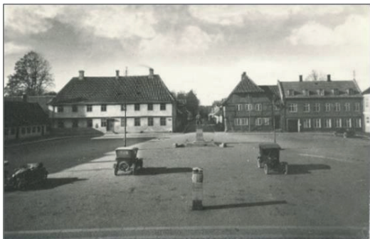
Postkort der viser Sorø Torv omkring 1922.

Det vedtoges at anskaffe den ommeldte 0-Sten”.