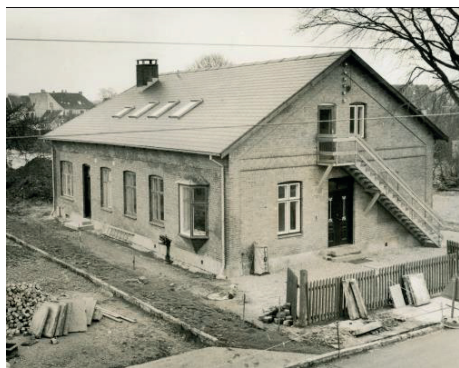
Frederiksvej 5.