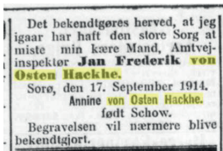
Berlingske Tidende 19. sept.1914

Vejinspektøren havde været en Tur paa Landet, og kom mellem Kl. 8 og 8½ cyklende i Boldhusgade paa Vej til sit Hjem. Da han var naaet omtrent ud for Skomager Diekelmann, styrtede han af cyklen, ramt af et Hjerteslag. Han aandede endnu svagt, da tililende Folk vilde hjælpe ham, men døde kort efter at han var baaret op i en Bil, der førte ham til hans Hjem. Amtsvejinspektøren blev 61 Aar gl.; han havde i de sidste Aar været noget svagelig”.