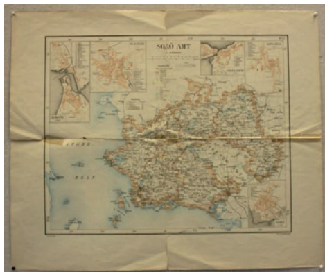
Kort over Sorø amt 1890-1920.