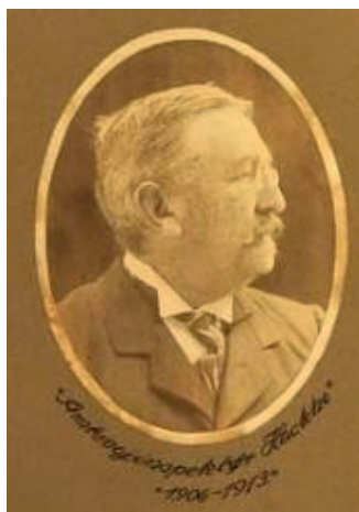
Udsnit af foto af Sorø Byråd i perioden 1900-1913