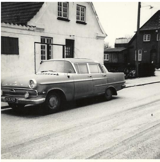
Billede af huset Fredensgade 7