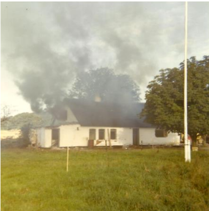
Nedrivelse af forældrenes ejendom.

De købte ejendommen som herefter blev revet ned og byggede her en ny fabrik, der hvor den gamle ejendom havde lagt.