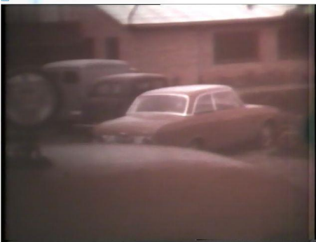
Et lidt utydeligt billede ved starten i 1964