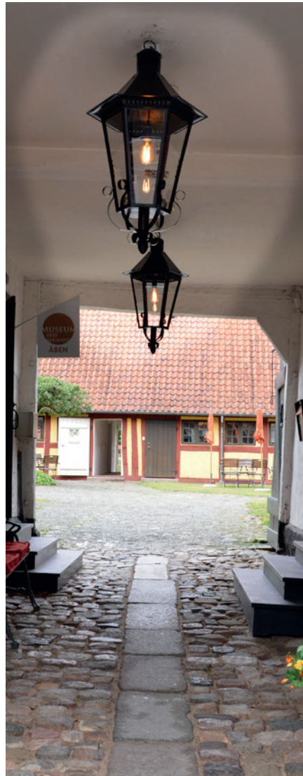
Sorø Museumsforening har betalt restaurering/ophængning af de to gamle lamper i portrummet på Sorø Museum.

Traditionen tro inviterer Museumsforeningen til julehygge med julegløgg og julekager.