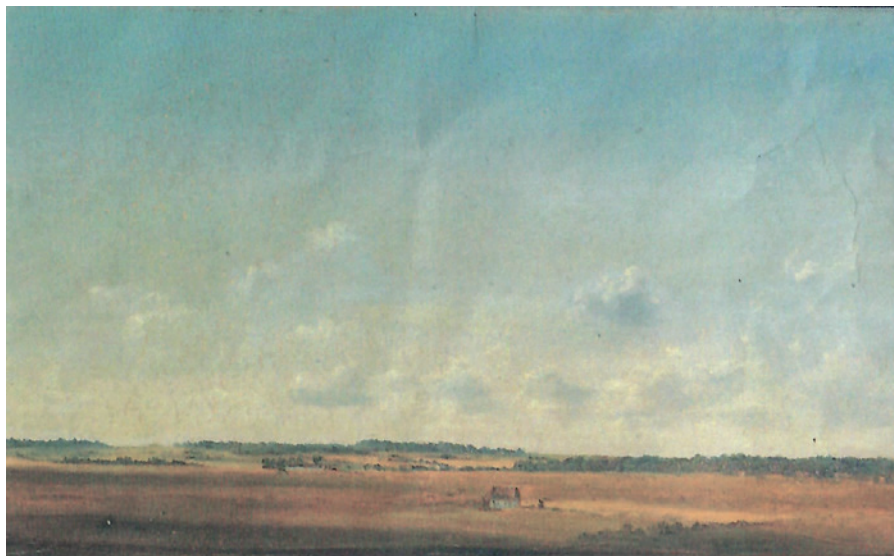
Motiv fra Tersløse.

Loven om hegning af skove kom i 1805, men det tog lang tid inden disse blev bygget, og inden man vænnede sig til ikke at lade sine kreaturer og svin finde føde