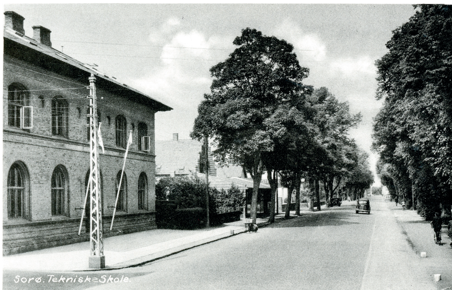
Alléen for træerne til venstre for kørebanen blev fældet til fordel for en cykelsti. Til venstre ses Sorø Teknisk Skole.

I fugtige vintre var vejen næsten ufredkommelig, når det var tørt, dannede der sig støvskyer efter kørsel på vejen. Ifølge folketællingerne fra 1916 var Strædet det officielle navn, men blev ved næste tælling i 1921 ændret til Alléen.