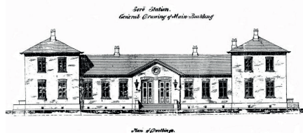
Sorø Station på Frederiksberg Tegnet af engelske ingeniører

Sorø Jernbanestation ligger på Frederiksberg. Men da stationen blev indviet af kong Frederik (VII) og grevinde Danner 26. april 1856, var der ikke noget Frederiksberg. Der var i det hele taget kun en station i et smukt landskab, tæt ved Sorø Sø. Gården Lundsgård der havde lagt jord til stationen lå 2-300m fra den nye station. Den driftige gårdmand havde dog set mulighederne og havde fået opført et hotel med rejselade lige overfor stationsbygningen. Området her på "Lunden" - som man fra gammel tid kaldte området i den nordligste del af Lyng Sogn, var med jernbanen blevet et område med helt nye muligheder. Jernbanen havde