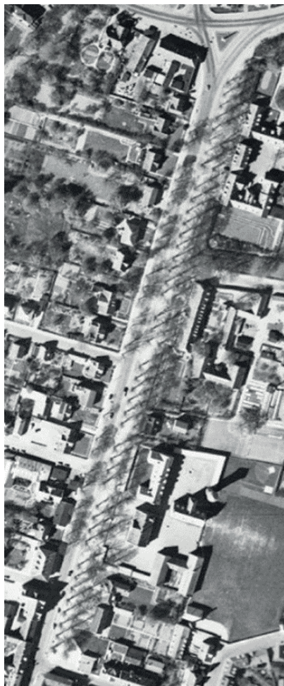
Øverst ses Albertikrydset med Slagelsevej til venstre og Ringstedvej til højre, nederst Absalonsvej. Lidt over midten ses Fægangen. Udsnit af luftfoto fra 1954. Nord opad.

Som følge af kvægdriften blev Strædet dækket af et lag gødning, der efter regn blev til mudder.