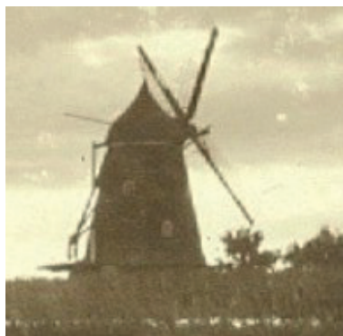
På Sorø Lokalarkiv findes dette foto der angiveligt forestiller Frederiksberg Mølle