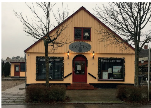
”Frederiksberg Mølle 2021”

bygningerne og Hotel Sorø der er blevet en boligejendom som et vigtigt minde om starten på en bydel der efterhånden har samme indbyggertal som den gamle købstad. Vindmøllen er væk men ”Møllegården” eksisterer endnu og bydelen identificerer sig med at bo på F R E D E R I K S B E R G -så tak til Frederikkens fødeby!