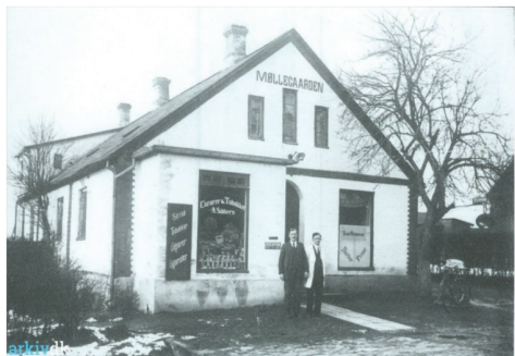
Møllegården -1923 Tobaksforretning samt barber og frisør