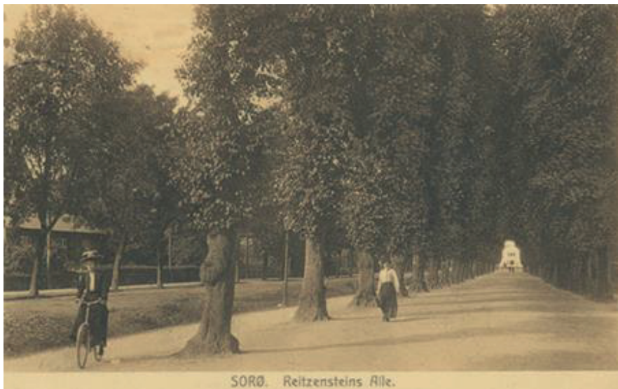
Reitzensteins Allé omkring 1910. I det fjerne ses villaen på Ringstedvej 1.

Omkring år 1910 blev der lagt en halv meter jord oven på den oprindelige flade. Det gik ud over træernes rødder, der havde svært ved at ånde, og i løbet af de næste 50 år gik en del af træerne ud.