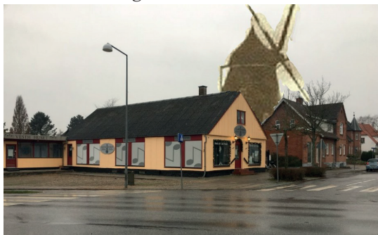
Her ses Frederiksberg Møllens hovedbygning i 2020. Jeg har manipuleret med fotoet og ”genopført” møllen, der blev nedrevet i 1906-7.