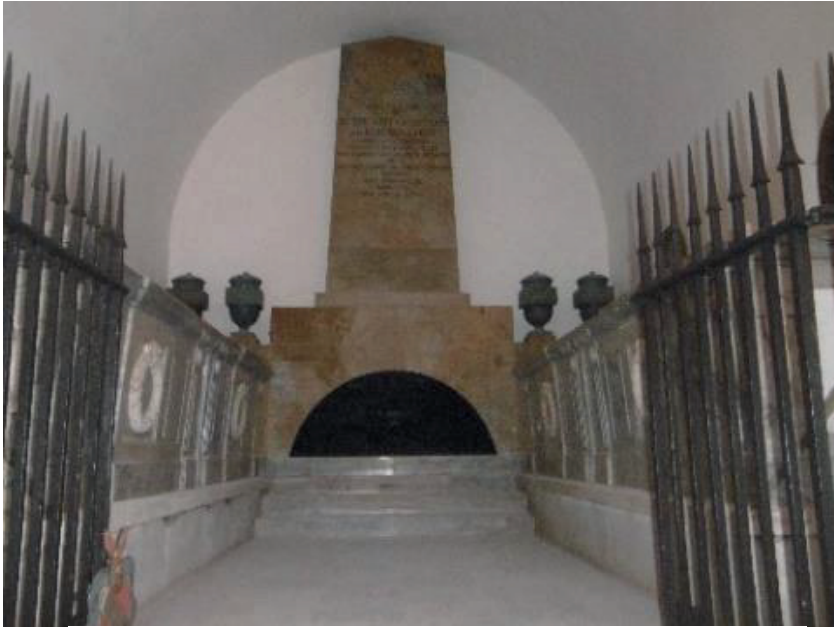
Reitzensteins gravmæle i Sorø Kloster-kirke. Foto nov. 2021 VMB.

Reitzenstein trak sig tilbage i 1780 efter 14 år i Sorø og døde året efter. Han hviler i en sarkofag, der står i Sorø Klosterkirkes søndre kors arm, hvor der er en mindetavle over ham.