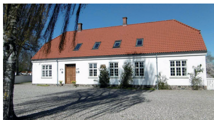
Den nye præstegård.