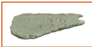
Del af forgyldt sværdfæstegreb.

Entré for ikke-medlemmer 75 kr. Der serveres kaffe. Brød kan købes for 20 kr.