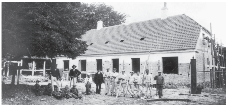
Håndværkerne fotograferet ved den næsten færdige Munke Bjergby Præstegård i 1910. Bemærk den gamle vandpost af træ til højre i billedet.