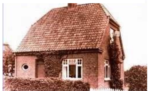
5 Højvang 2, Vejen