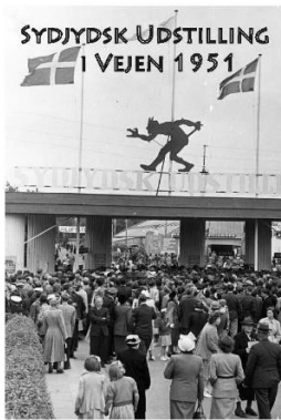
7 Sydjysk Udstilling 1951