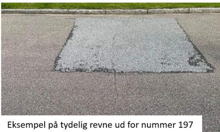
Eksempel på tydelig revne ud for nummer 197