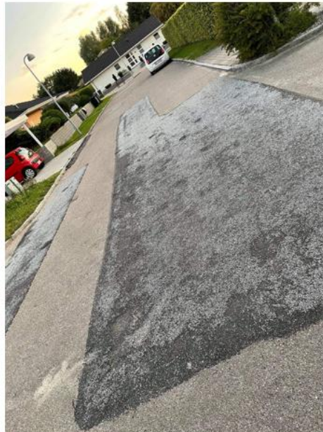
2017 reparationen er ved at være slidt ned