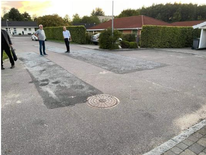
Vendepladsen ved 191, 193 bærer tydeligt præg af slid, både indenfor og udenfor reparationen fra 2017