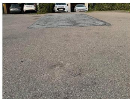
Overflade skader og lunger ved vendepladsen mod 223 og 225