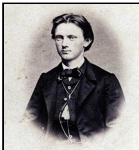
Poul la Cour .