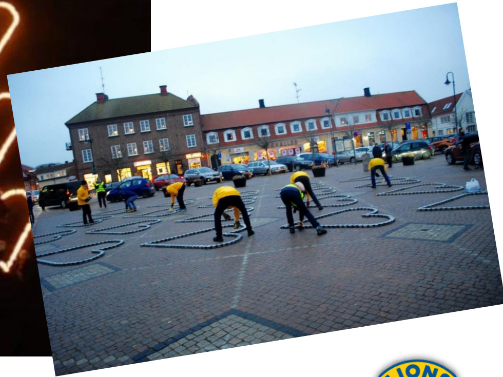
Torget med ljushjärtan avbildat av en drönare