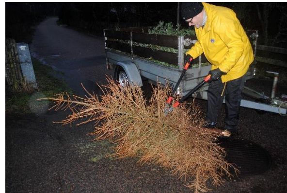
Bilder från granhämtningen 2020