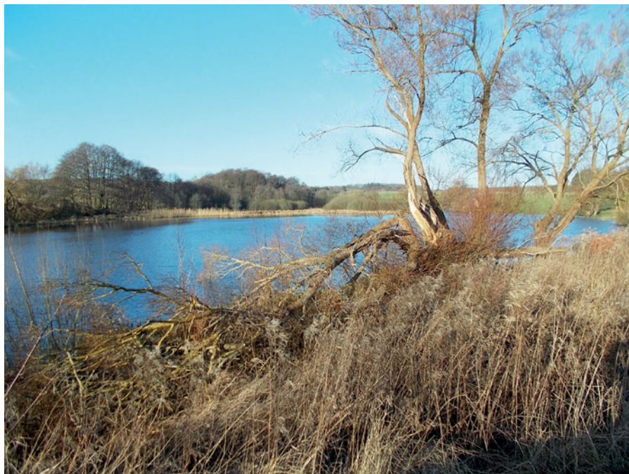
Den opdæmmede Møllesø ved Kongskilde.