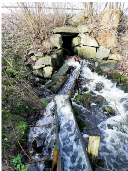
Den nuværende mølledæmning ved Kongskilde. Vandet fra Møllesøen løber gennem en stenkiste i dæmningen og ad afløbskanalen videre ud i Tystrup Sø.

oversvømmede enge og græsgange, så de pludselig stod under vand. Engene blev brugt af bønderne til græsning og høstet. I andre tilfælde kunne nye møller tage vandkraften fra aktive møller længere nede ad åerne, når vandmængden faldt. Der var mange retssager om disse problemer, for eksempel klagede lodsejerne i Skørpinge (1547) over, at møllen gjorde stor skade på deres enge, og mølleren i Valby (1552) klagede over, at Pine Mølle tog vandkraften ved opstemning.