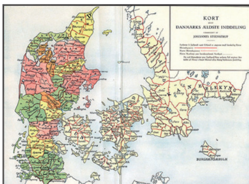
De middelalderlige herreder i Danmark (Steenstrup)

I dette foredrag vil der på baggrund af arkæologiske og historiske kilder gives et bebyggelseshistorisk perspektiv på herredsinstitutionens oprindelse og ældste historie.