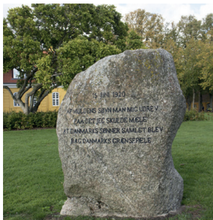
Stenen i Akademihaven i Sorø

Af Muldens Søvn man mig udrev, Paa det jeg skulde mæle, At Danmarks Sønner samlet blev, Bag Danmarks Grænsepæle.