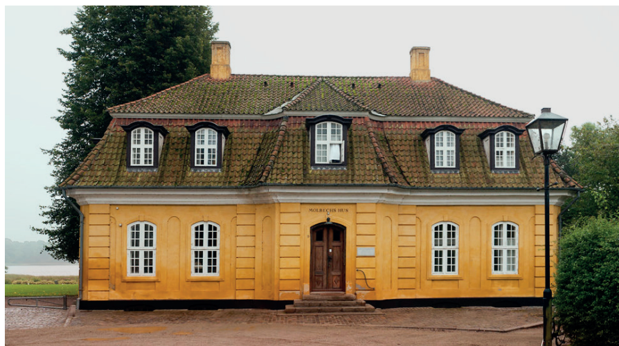
Molbechs Hus vest for Sorø Akademis hovedbygning – øst for ligger Ingemanns Hus. Begge professorboliger blev bygget til Frederiks V's Akademi i 1747.

at studere teologi. I 1778 blev han ansat på akademiet, hvor han i 1787 blev professor i filosofi og matematik.