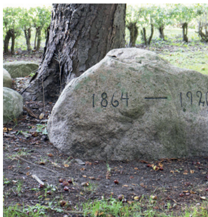
Stenen på Stenstrupvej

Og endelig blev der i Pedersborg etableret et ”Minde” bestående af en stenkreds og et genforeningstræ. Et lindetræ plantet af ungdomsforeningen ”Pedersborgs Ungdom”. Det er placeret på hjørnet af Volden og Kirkevænget. Lige overfor Pedersborg Forsamlingshus.