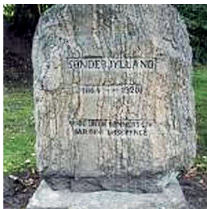
Stenen i Pedersborg

Foreningen ”Flensborgs Venner” eller Flensborgbevægelsen, som ønskede byen Flensborg med som en del af det danske rige, holdt den 9. juli en højtidelighed på hotel ”Klubben” i Rolighed. De flagede på hel stang til klokken 14 og derefter på halv stang til solnedgang.