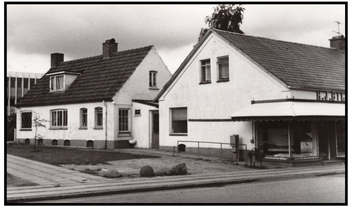
Gartner Hans J. Bills forretning, Nørregade 14 i Vejen.

forbindelse med binding af kranse og æresport op mod juletid. Hun bandt de mange, mange meter granguilander, der skulle hænges op i Nørregade og Søndergade hvert år i december. Et arbejde, der bestemt krævede sin kvinde.