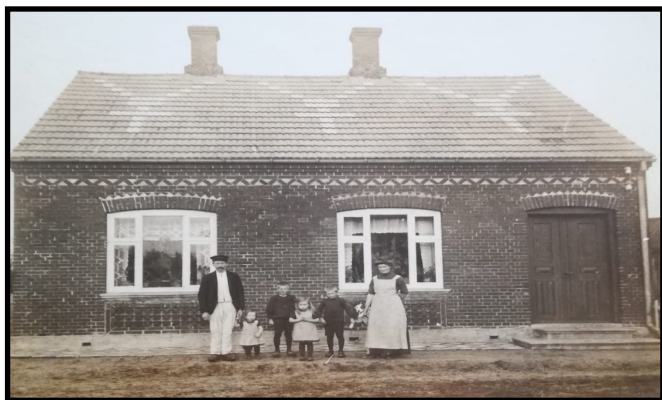
Korsgade 4, Vejen (ca. 1913)