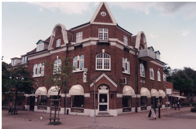
Nørregade 28, 6600 Vejen.