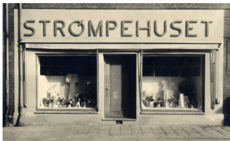
Strømpehuset, Nørregade 24, Vejen.