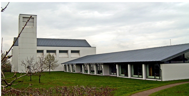
Gullestrup kirke ved Herning.

Udenfor Vejen by - Roust Savværk: Produktionshaller og administrationsbygning. Nyt stort missionshus i Ålborg, Bethesda, som blev præmieret af kommunen. Det sidste projekt, jeg vil nævne, er Gullestrups nye kirke. En opgave jeg fik uden nogen form for konkurrence. Jeg fik en dag et brev med posten, hvori der stod, at et enstemmigt menighedsråd i Gullestrup har besluttet at opfordre mig til at projektere deres nye kirke og præstegård.