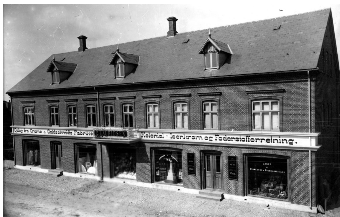
Lauridsens købmand og foderstofforretning i Søndergade 10, Vejen.

Da Første Verdenskrig brød ud i 1914 ramte det også Danmark. Krigen skabte ressourceknaphed, og priserne på korn stak i vejret. Snart kom lovind- greb: Det blev forbudt at fodre dyr med brødkorn, der indførtes et prisloft og senere blev der indført afleveringspligt på korn.