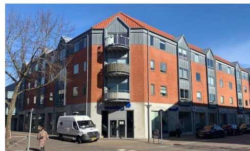
Støberigården i Vejen.