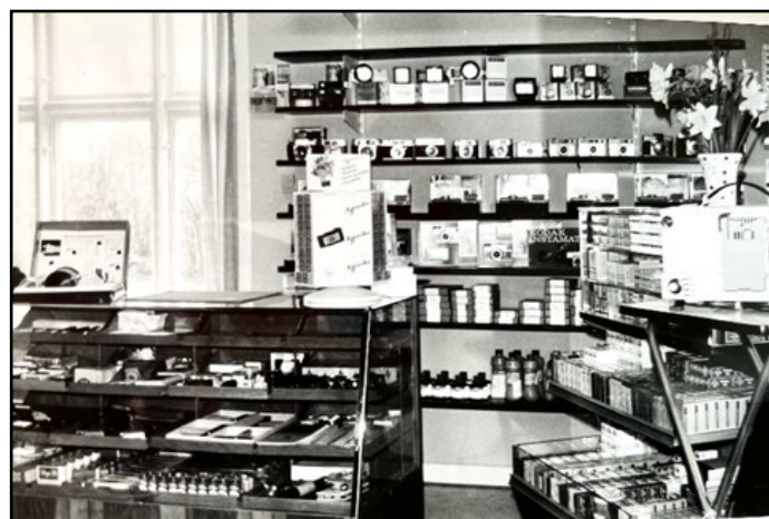
Fotoforretningen i Nørregade 4

Da vi i 1962 ventede vores andet barn og stadig ikke kunne finde noget at bo i, besluttede vi at bygge det hus på Svalevej, jeg stadig bor i.