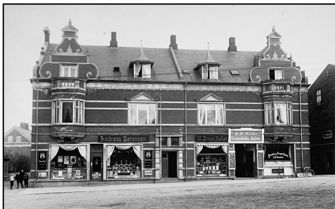
Nørregade 4 fra 1904

Den smukke bygning i røde mursten med karnapper og tvillingetårne på Nørregade 4 og 6 blev opført i 1904 og har fra begyndelsen huset Vejens fotograf. Historien om det, der med tiden blev Vejen Foto i sluthalvtredserne, løber parallelt med fotografiets hastige udvikling.