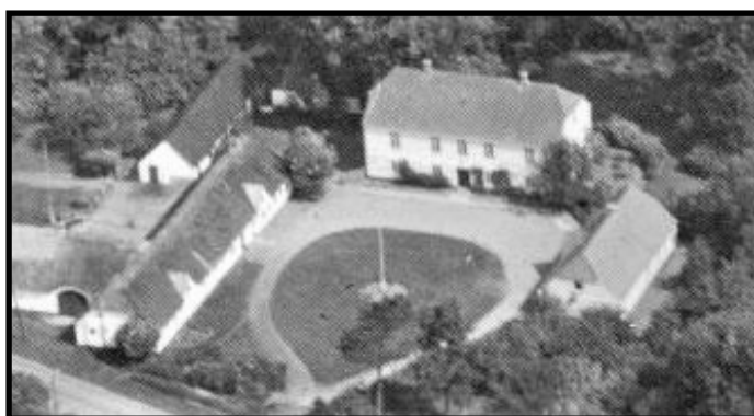
Luftfoto af den gamle præstegård.

Læborg er et landsogn, mens Vejen by i hans tid gennemgik en stadig udvikling som industriby. Far kom til et embede, der var 3½ gange større end det, han havde haft. Den gamle store præstegård og haven nede ved Vejen å og Hovedvej 1 var en perfekt ramme i hvert fald for familiens nu i alt seks drenge, men da den også var upraktisk og dyr i drift, besluttede menighedsrådet at sælge den, og i 1955 stod en ny præstegård klar til indflytning på Baungårdsvej med konfirmandstue i kælderen, men i øvrigt ikke væsentligt forskellig fra et almindeligt parcelhus i Vejen.