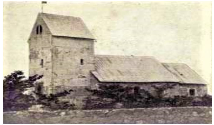
Vejen gamle kirke