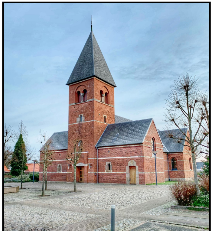
Vejen kirke.