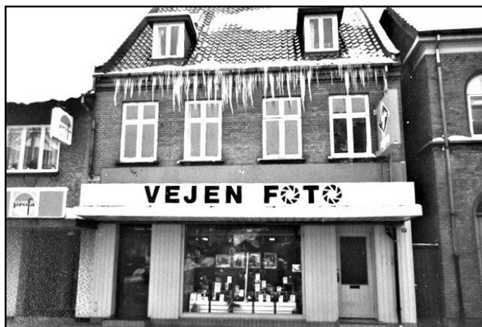
Vejen Foto i Søndergade 3