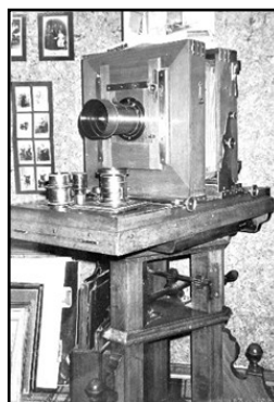
Salonkamera overtaget med forretningen

I begyndelsen fotograferede man på glasplader. Man havde ikke forstørrelsesapparater, så billederne blev taget på en glasplade i samme størrelse, som fotografiet skulle fremkaldes i. I fotoatelieret på første sal var der sat en liste over de store vinduer, hvorpå man placerede glaspladerne sammen med fotopapir. Pladerne og papiret blev holdt på plads af ståltråd, der var spændt hen over vinduet. På denne måde blev fotopapiret belyst af dagslyset.