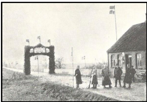
Æresport ved Skodborghus

Langs den gamle grænse, ved stationsbyerne og ved indgangen til landsbyerne var rejst æresporte i hundredevis. En af disse porte, der var rejst ved Skodborghus, bar en indskrift, som mindede om indskriften på