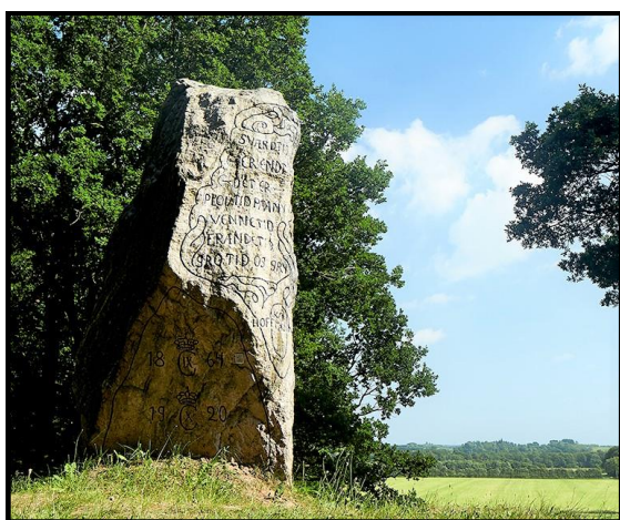
Genforeningsstenen Skibelund Krat.

Stenen er placeret på toppen af en gammel kæmpehøj i den østligste ende af monumentparken som et symbolsk punktum på rækken af monumenter. Det var næsten en selvfølge, at Skibelund Krat måtte have en genforeningssten. Den over 3 m høje granitsten med inskriptioner på to sider er forsynet med kongelige navnetræk. Stenen er udført af Niels Hansen Jacobsen, Vejen.